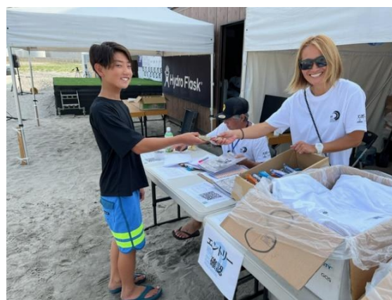
フィッシュソーセージ配布の様子