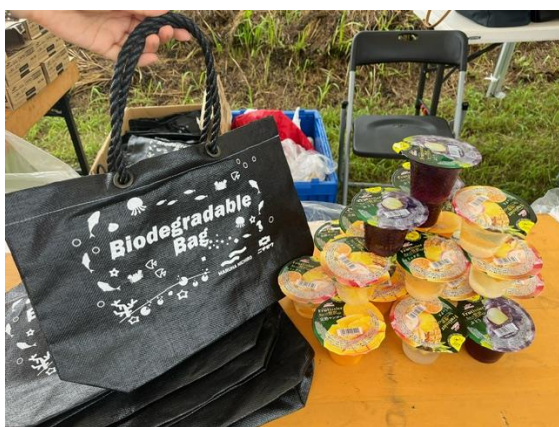
参加賞として配布したバッグとゼリー