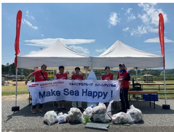
回収したごみとともに

大会期間中の7月5日、6日において、マルハニチロが企画したクリーンアップ活動「Make Sea Happy!」を開催し、同大会の出場選手や関係者を中心に延べ115名が参加されました。参加者にはフルティエゼリー：ちょっと贅沢 ぶどう、ちょっと贅沢 ミックス、ちょっと贅沢 完熟マンゴーの中から好きな商品を1つプレゼントしました。その他ニチモウ株式会社様ご協力のもと制作した、生分解性プラスチックを用いたエコバッグも参加者に配布しました。