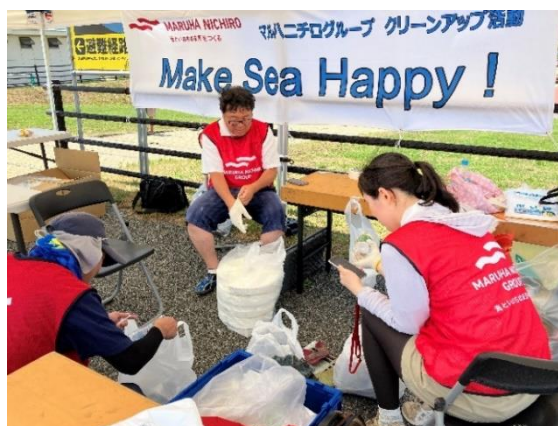
ごみの分類集計作業の様子